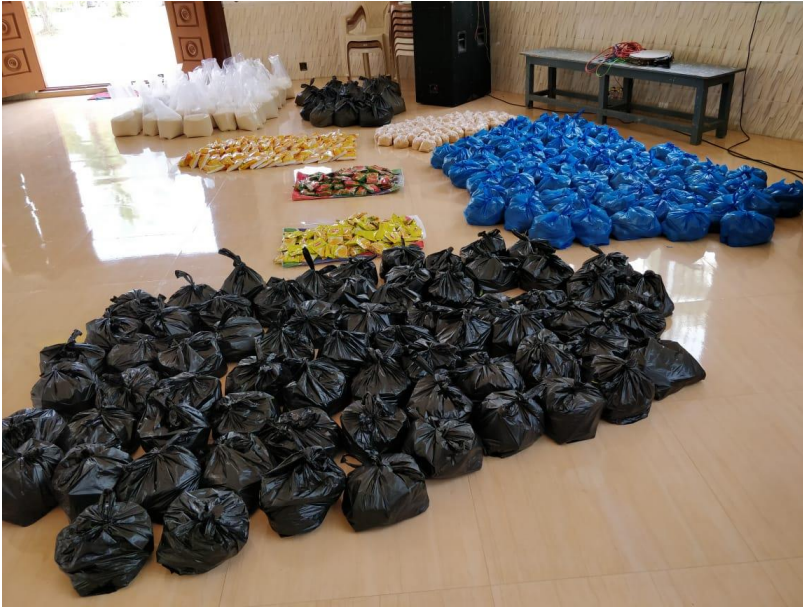
Die gekauften Lebensmittel für die Familien.