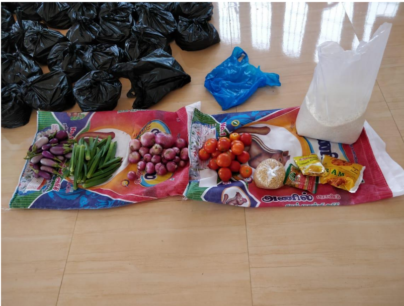
Das Paket für eine Familie.