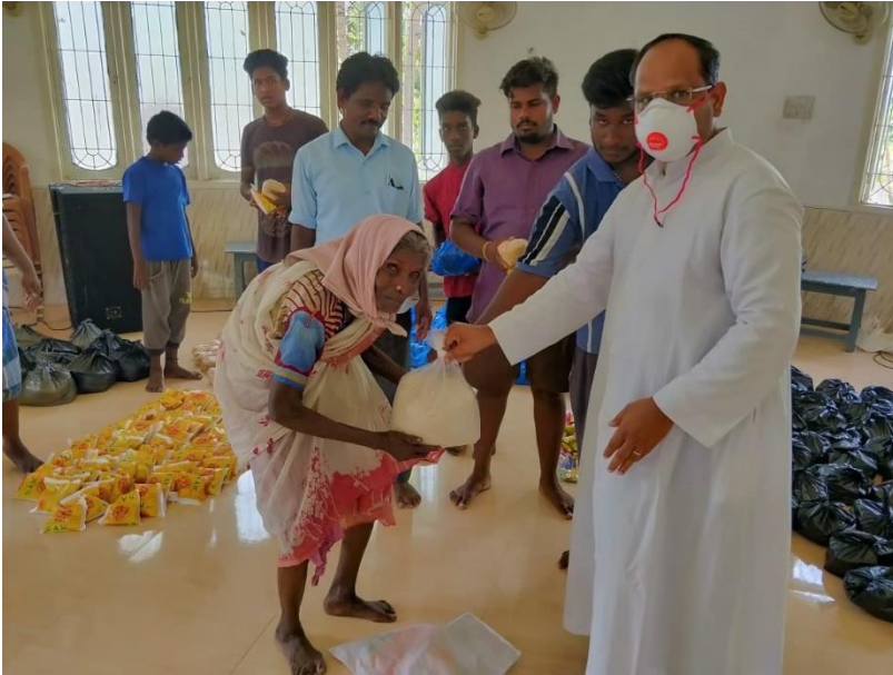
Auch Wittwen und Alleinstehende werden nicht vergessen.