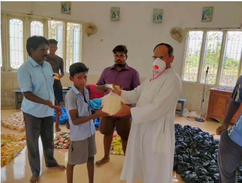
Die Übergabe der ersten Lebensmittelspende.